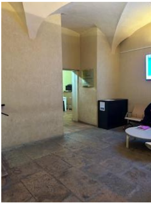
Hall d'accès entre les cellules et la salle d'audience