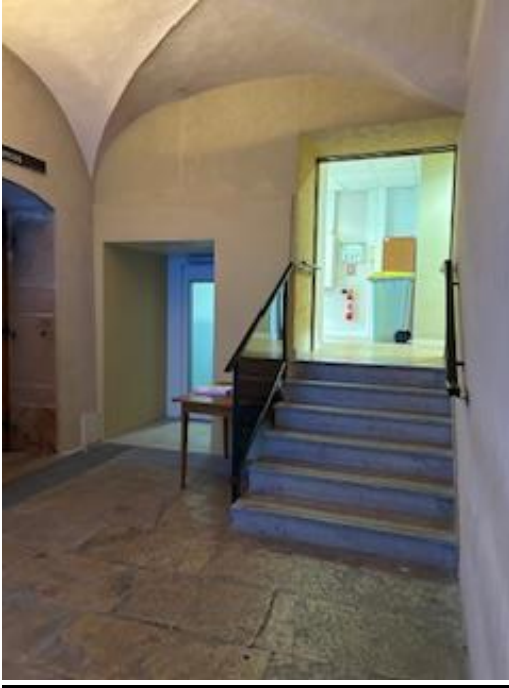
Escalier devant être emprunté pour se rendre en salle d'audience