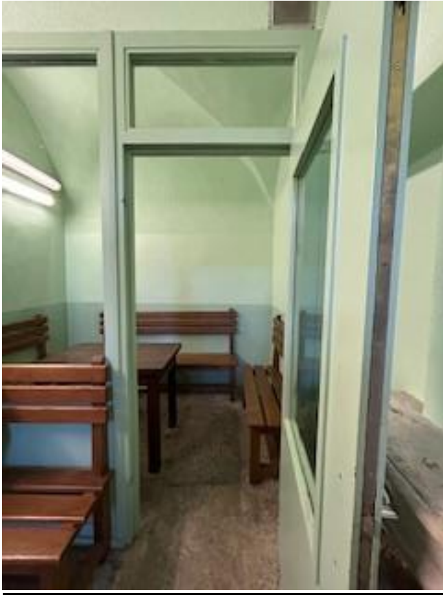
Celle d'entretien avec l'avocat