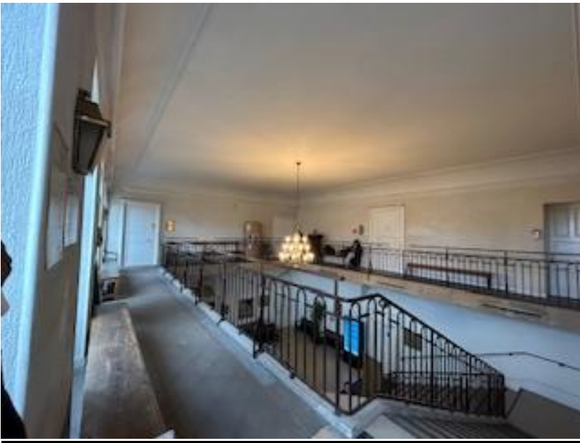
Galerie desservant la salle d'audience pour le JAP