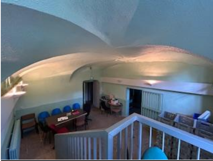
Vue depuis l'entrée