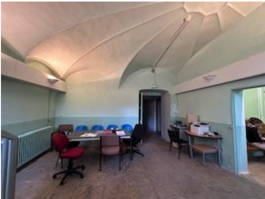
Salle d'attente pour les escortes