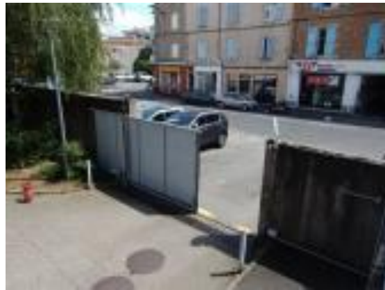
Portail d'accès à la cour intérieure

Un escalier d'un demi-étage permet d'accéder à l'intérieur du bâtiment dans la zone du poste de police. Il n'existe aucune facilité d'accès pour les personnes en mobilité réduite ni côté accueil du public, ni côté zone de sécurité.