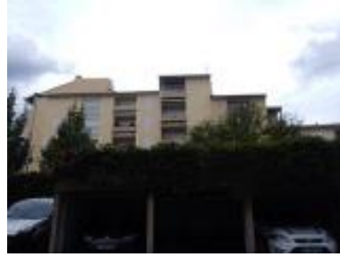
Immeubles ayant vue sur la cour du commissariat

Un escalier d'un demi-étage permet d'accéder à l'intérieur du bâtiment dans la zone du poste de police. Il n'existe aucune facilité d'accès pour les personnes en mobilité réduite ni côté accueil du public, ni côté zone de sécurité.